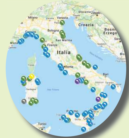
Mappa 1: distribuzione geografica degli spiaggiamenti su cui sono intervenuti gli IIZZSS.

Gli IIZZSS territorialmente competenti sono intervenuti complessivamente su un totale di 78 soggetti su 174 spiaggiati (44,82 %), come dettagliato in Tabella n. 3.